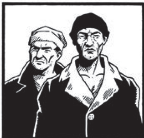
Chi stava ai margini ieri

Oggi l'orizzonte culturale è diverso, la stessa sottocultura sembra funzionare in maniera differen-