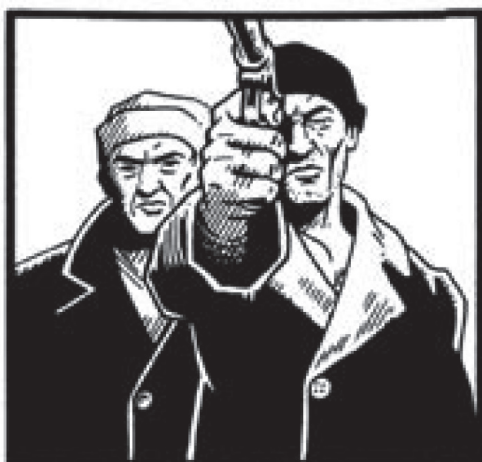
Chi sta ai margini oggi